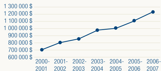
Évolution de l'avoir des membres CMA

La date de versement de la cotisation était le 1 er février 2006.